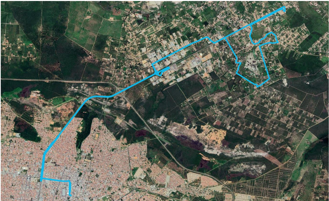
Figura 5 – Itinerário da Linha R17