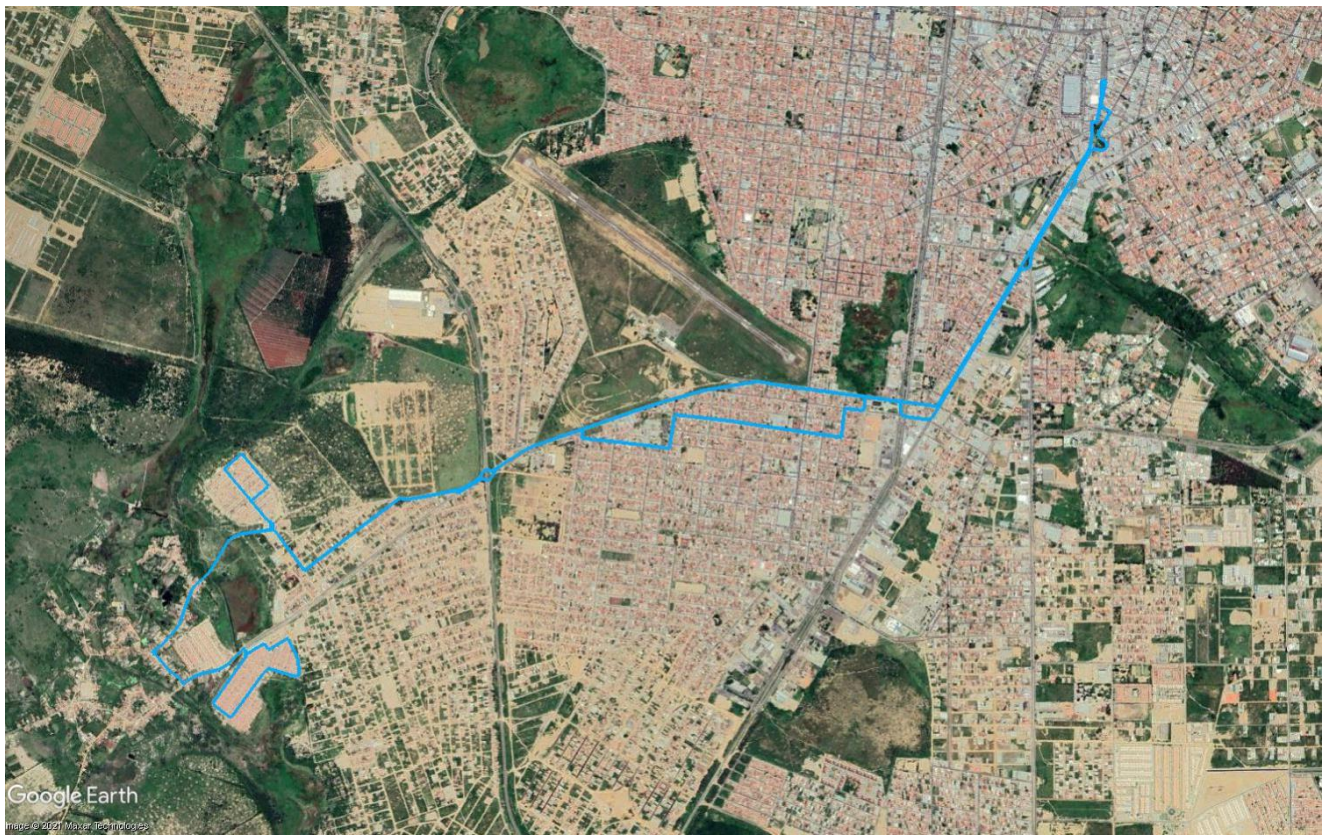
Figura 7 – Itinerário da Linha R27