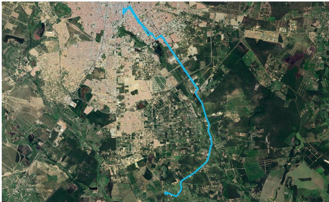
Figura 2 – Itinerário da Linha R04