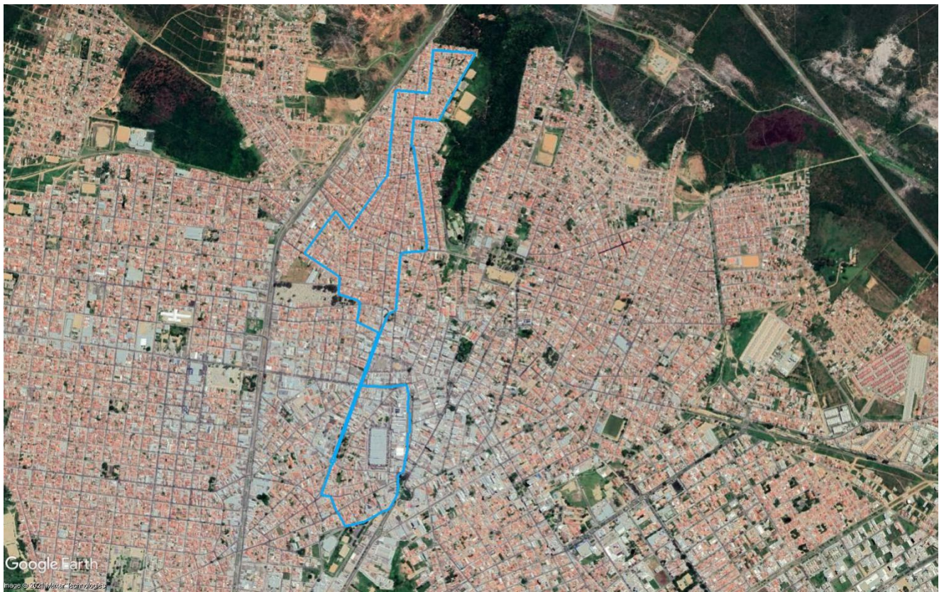
Figura 4 – Itinerário da Linha R13