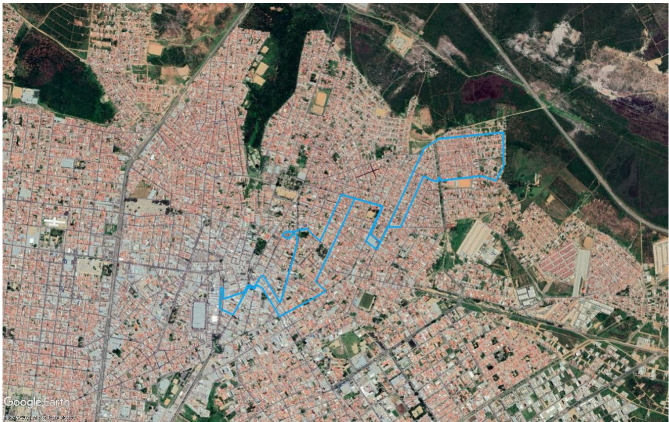
Figura 8 – Itinerário da Linha R62