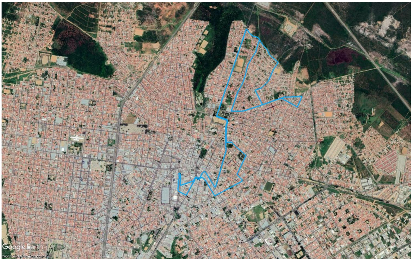
Figura 6 – Itinerário da Linha R24