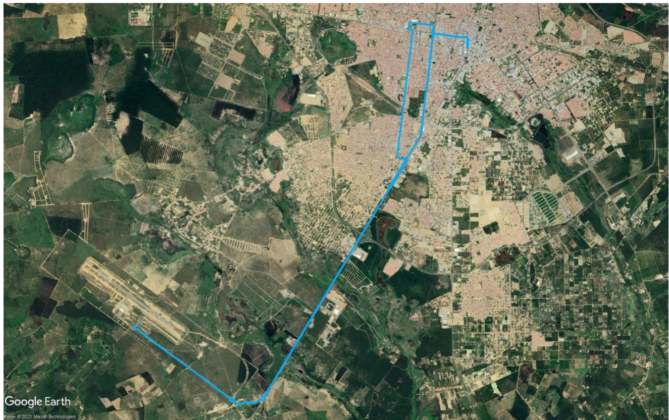
Figura 9 – Itinerário da Linha R65