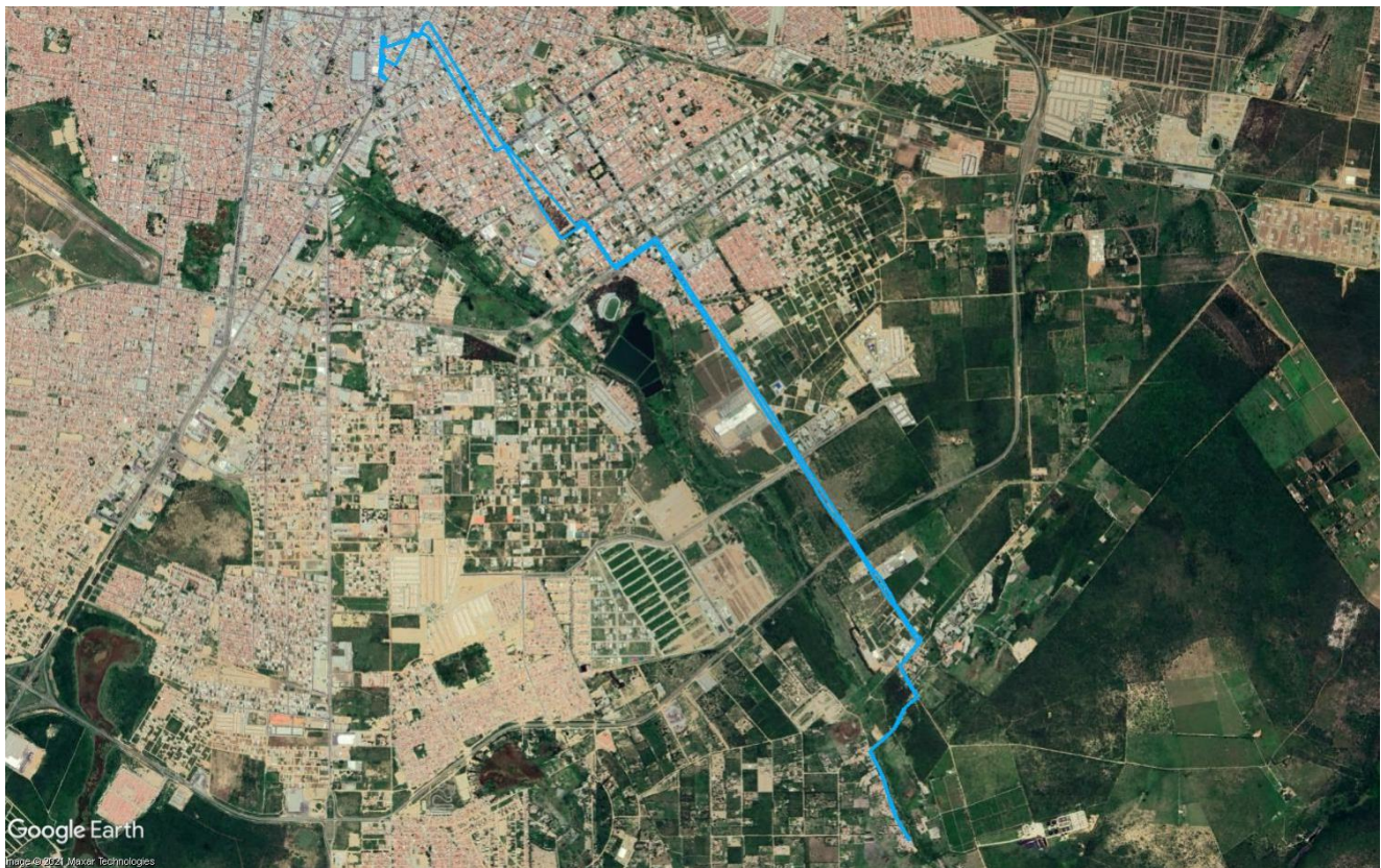
Figura 11 – Itinerário da Linha Estiva