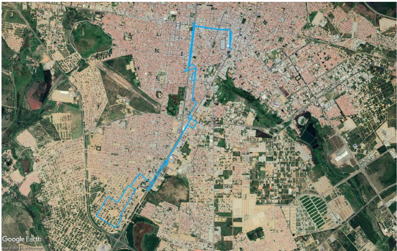
Figura 3 – Itinerário da Linha R11