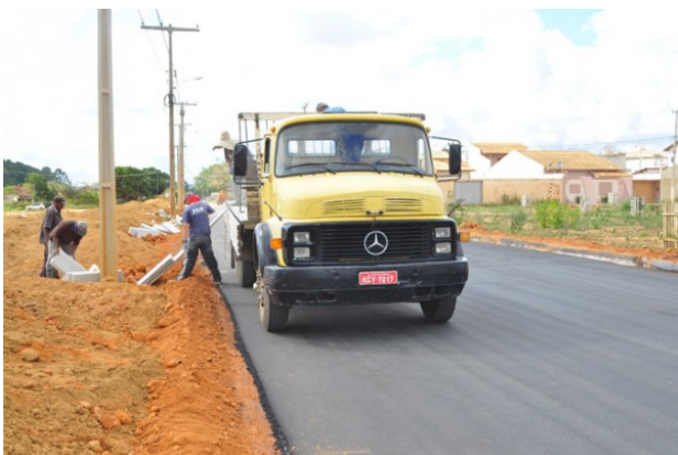
No Loteamento Esplanada do Parque as melhorias abrangem 22 vias