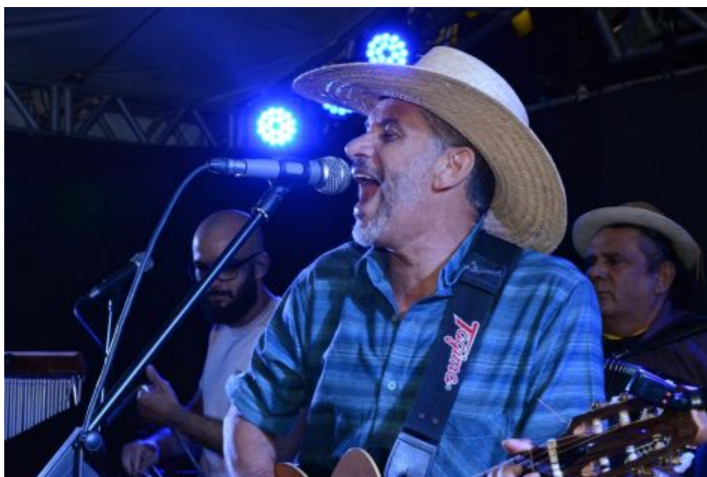
Juá da Bahia